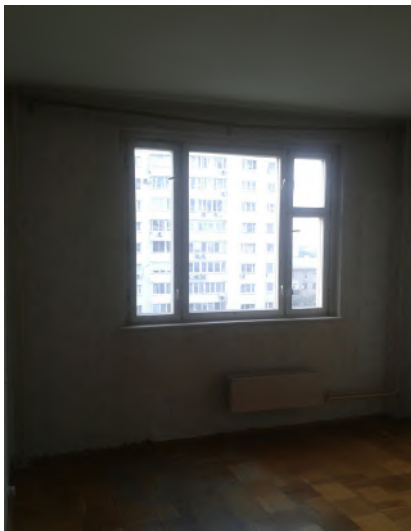
Фото квартиры до ремонта