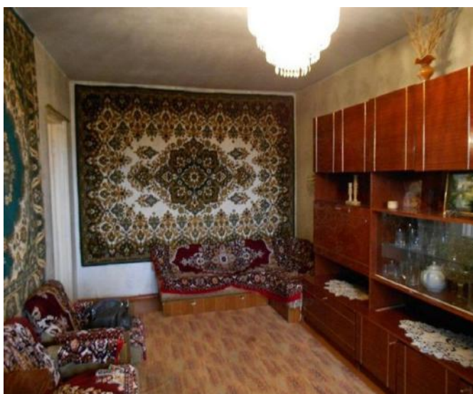
Фото квартиры до ремонта